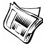
Abb.to web max € 175,00